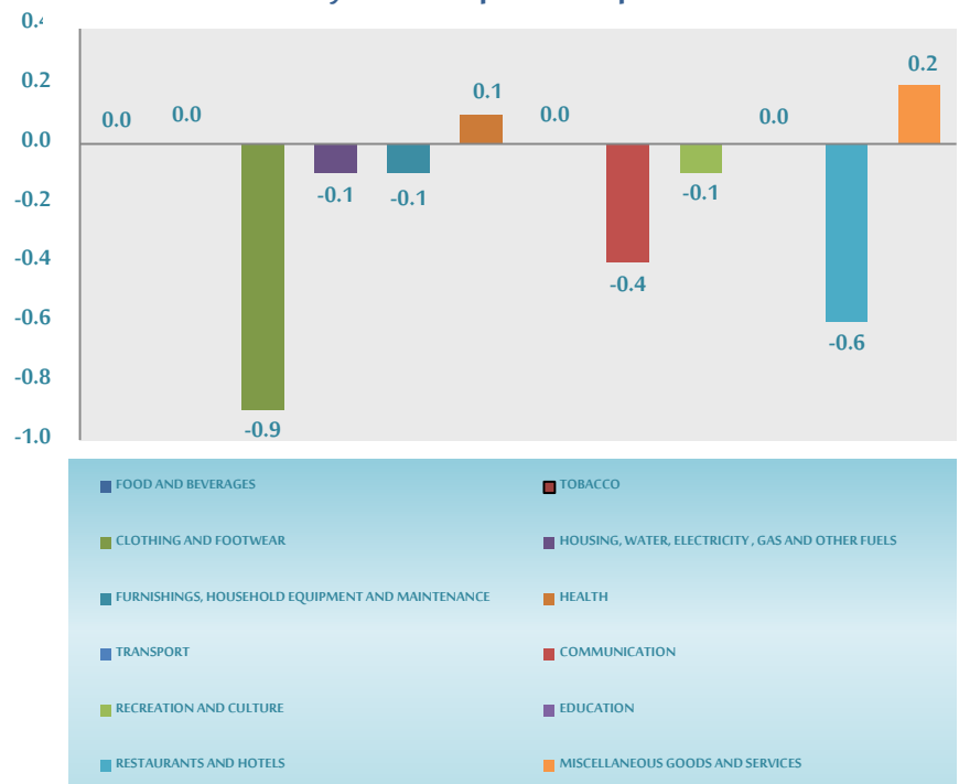
monthly relative change of main sections during the month of May 2017 compared to Apr 2017