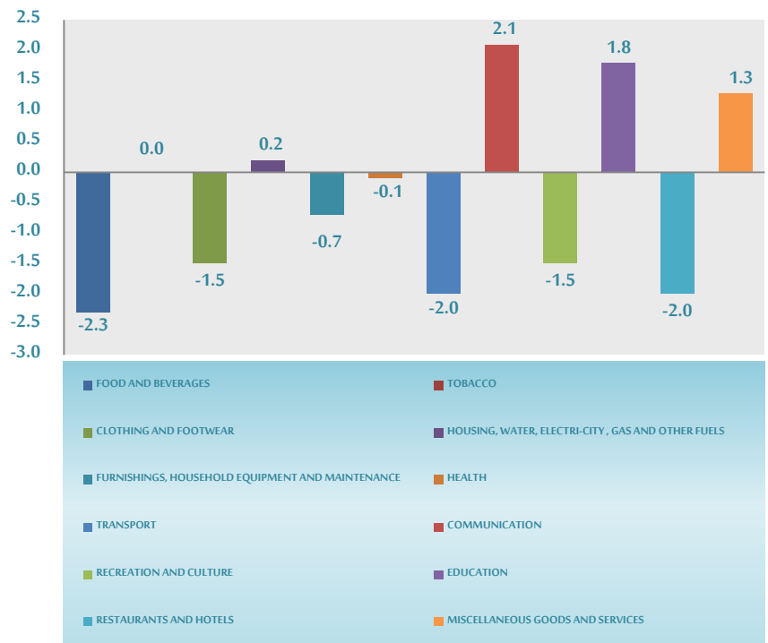
Annual changes relative to the main sections through May2017 compared to May2016