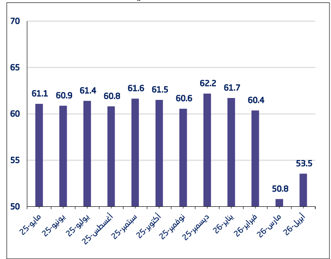
شكل 1. مؤشر ثقة الأعمال في قطاع الصناعة

سجل مؤشر ثقة الأعمال خلال شهر أبريل 2026 في قطاع الصناعة مستوى متفائلاً بلغ 53.5 نقطة، مرتفعاً بمقدار 2.7 نقطة، مقارنة بشهر مارس 2026 والذي سجل 50.8 نقطة. ويعزى ذلك المستوى إلى تزايد الثقة في المنشآت الصناعية، خاصة في جانب توقعات الأداء العام، والمبيعات، وأوامر الشراء.