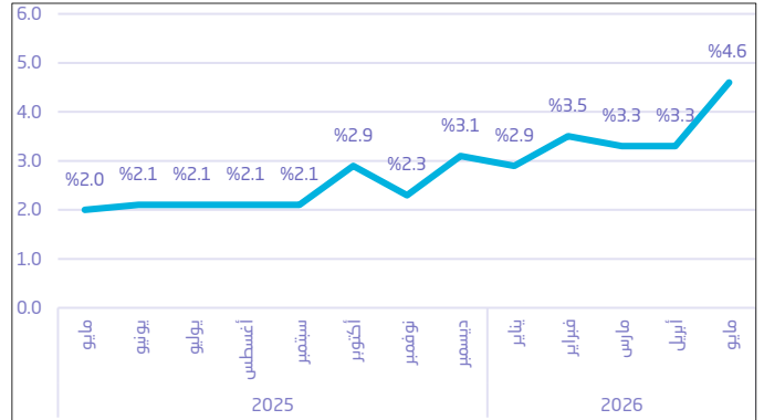
شكل 1. التغير في مؤشر أسعار الجملة (%) على أساس سنوي

يعكس مؤشر أسعار الجملة (WPI) تحركات أسعار السلع في مرحلة ما قبل البيع بالتجزئة لسلة ثابتة من السلع تتكون من 343 بنداً، تُجمع أسعارها بشكل شهري من ثلاث مدن رئيسية هي: (الرياض - وجدة - والدمام) من خلال الزيارات الميدانية لنقاط البيع، وقد تم تحديد سنة 2014م كسنة أساس، ويتم نشر إحصاءات مؤشر أسعار الجملة بشكل شهري. للمزيد من التفاصيل يرجى الاطلاع على: المنهجية والجودة ، و جدول النشر .