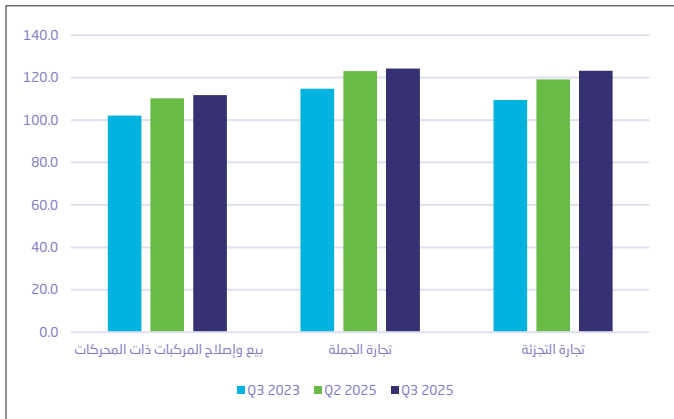
شكل 3: الرقم القياسي للمبيعات الإلكترونية حسب النشاط الاقتصادي

وعلى أساس ربعي سجل الرقم القياسي للمبيعات الإلكترونية لنشاط تجارة التجزئة - باستثناء المركبات ذات المحركات والدراجات النارية - ارتفاعاً بنسبة 9.2%، كما ارتفعت المبيعات الإلكترونية لنشاط تجارة الجملة - باستثناء المركبات ذات المحركات والدراجات النارية - بنسبة 4.0%، وشهدت المبيعات الإلكترونية لنشاط بيع وإصلاح المركبات ذات المحركات والدراجات النارية ارتفاعاً بنسبة 0.9%