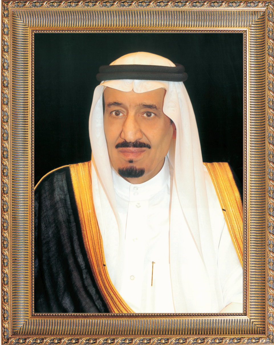
خادم الحرمين الشريفين الملك سلمان بن عبدالعزيز آل سعود