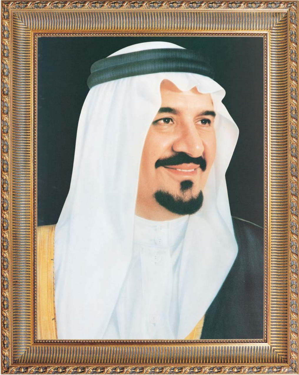
صاحب السمو الملكي الأمير سلطان بن عبدالعزيز آل سعود ولي العهد نائب رئيس مجلس الوزراء وزير الدفاع والطيران والمفتش العام