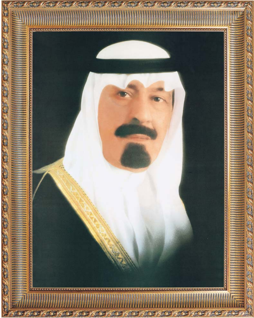
خادم الحرمين الشريفين الملك عبدالله بن عبدالعزيز آل سعود